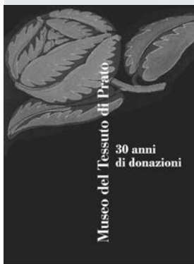
Copertina provvisoria del catalogo